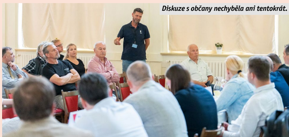
Diskuze s občany nechyběla ani tentokrát.

brandu a jeho zavedení na trh v roce 2022. Dnes se zmrzlina z benešovské továrny vyváží do 30 zemí Evropy.