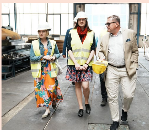
Výrobní hala firmy BAEST Machines & Structures.

– zmrzlinu. Firma Pinko je na českém trhu již 30 let a k jejímu vzestupu také dopomohlo i Středočeské inovační centrum (SI-C). Díky programu INO:EX Středočeského inovačního centra navázal benešovský výrobce zmrzliny spolupráci s kreativní agenturou Proboston, která se postarala o celkovou identitu nového