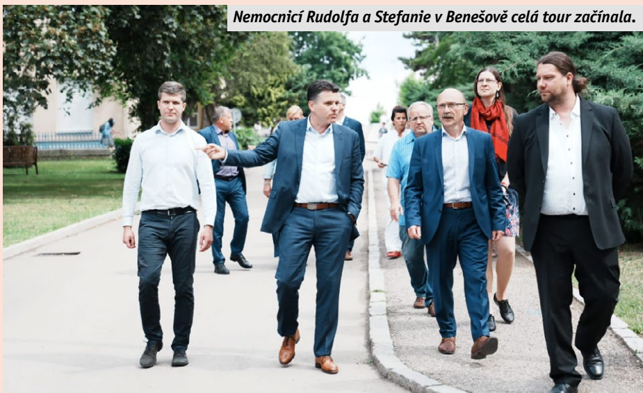
Nemocnicí Rudolfa a Stefanie v Benešově celá tour začínala.

centrum a přihlásila se do programu INO:EX – Inovuj produkt a Expanduj na trh, což jí pomohlo vylepšit výrobu a implementaci nádrží na skladování H 2 a následně podpořilo marketing. Odpoledne se Rada Středočeského kraje vydala do firmy, která nabízí letní sladké pohazení