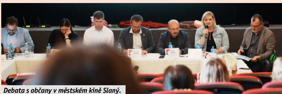
Debaty s občany v městském kině Slaný.

Odpolední program začal ve firmě LINET , která patří mezi trojici největších světových výrobců nemocničních lůžek a lůžek pro sociální péči. Linet je vysoce inovativní česká firma disponující rozsáhlou nabídkou produktů od prenatální péče po péči o seniory, lůžka pro pokročilou péči, transportní lůžka, křesla, matrace, asistenční systémy, příslušenství