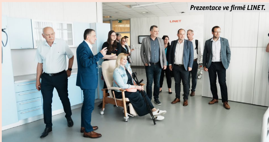
Prezentace ve firmě LINET.

Druhým bodem programu se stala Školní jídelna Slaný . Hlavním zaměřením školní jídelny je stravování žáků a studentů slánských základních a středních škol a pedagogických pracovníků, ale vaří obědy i pro seniory a ostatní strážníky. Důležitým tématem jednání byla rekonstrukce objektu a zajištění stravování po celou dobu oprav. Díky této investici, která bude zahájena letos v červnu, dojde k navýšení počtu strážníků až o dvojnásobek, tedy na 1200 jídel denně. V rámci plánované rekonstrukce by měla být školní jídelna Na Sadech vybavena i fotovoltaickými panely, které přispějí k úspornějšímu provozu tohoto nově zrekonstruovaného objektu.