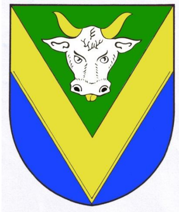
Znak obce Volárna